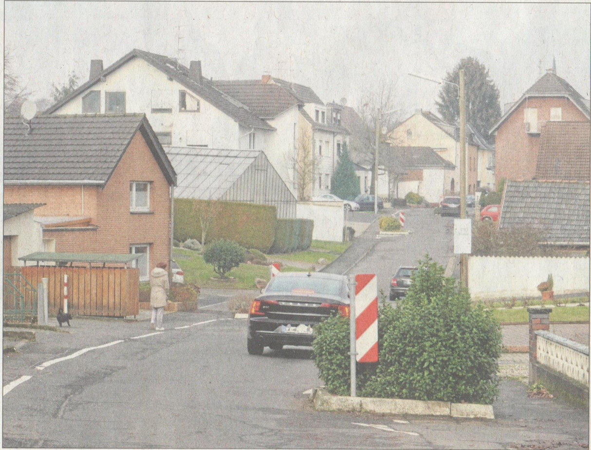
Soll ausgebaut werden: Die Offenbachstraße.

Sie sind der Ansicht, dass der Ausbau der Offenbachstraße nur zur Erschließung des Baugebiets Me 16 (siehe Info-Kasten) dienen soll. Daher wollen sie auch keine Anliegerinitiative bilden.